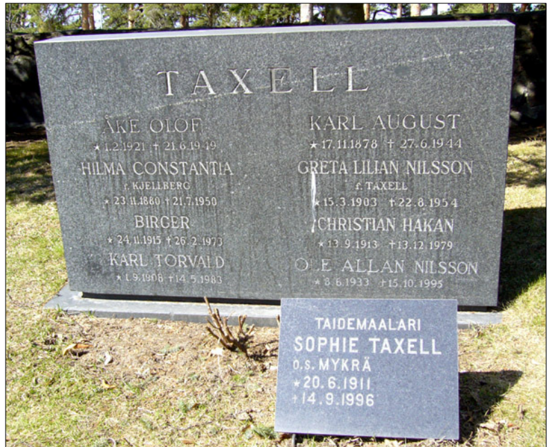
Kuva: Taxellin suvun hauta Hietaniemen hautausmaalla Helsingissä.

Palkinnot, kunniamerkit ja arvonimet: Kunniapalkinto "Kukkia ja taidetta" -näyttelyssä, USA 1978, Accademia Europea, Premio 1984-86, Targa D'Oro Assegnata Dalla Giuria, Accademia Italia, Calvatone, Premio D'Italia 1986, Premio Fiaccola D'Oro Conferito, Parlamento Mondiale USA. Ulkomaiset: Medal of Honor Commemorating Distinguished Lifelong Achievements 1989.